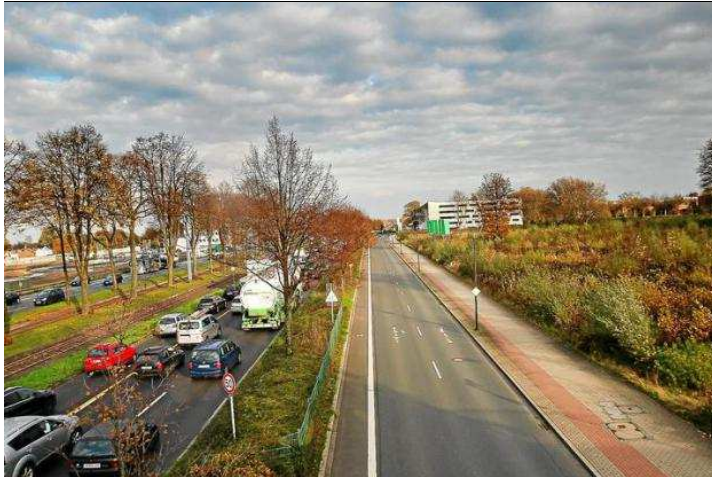
Meterhohe Lärmschutzwände sollen im Bereich der Stadtkrone-Ost entstehen, wenn die B 1 hier zur A 40 ausgebaut wird.

DORTMUND Büromeile oder Lärmschutz? Die Pläne für den Ausbau der A40 im Dortmunder Osten stehen erneut zur Diskussion. Straßen.NRW fordert meterhohe Lärmschutzwände an der Bundesstraße 1. Das würde den Plan von einem repräsentativen Einfahrtstor zerschlagen. Wo genau gebaut werden soll, sehen Sie in unserer Karte.